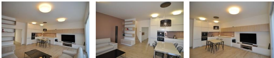
Byt Brno Komín